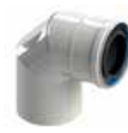
Codo 87° con puerta de inspección