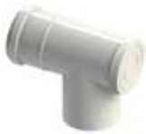
Te 87° con tapa de limpieza y conexión directa a caldera