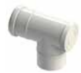
Te 87° con tapa de limpieza