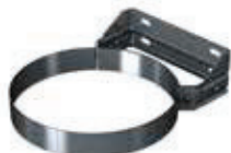
Abrazadera fijación pared regulable 50-80mm