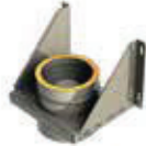
Soporte de carga regulable