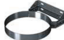
Abrazadera fijación pared regulable 50-80mm