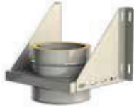
Soporte de carga regulable