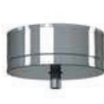
Colector de hollín con desagüe