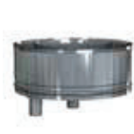
Colector de hollín con doble desagüe