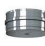
Colector interior para sobrepresión (incl. Junta)