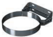
Abrazadera fijación pared regulable 50-80mm