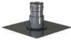
Adaptador a EW-ECO para patinillo