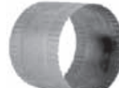
Conector, sin pintar