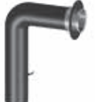
Tubo curvado reg. tiro y puerta + coll. + pasam.