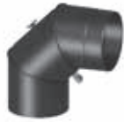
Codo ajustable 0°-90° con apertura de limpieza