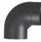
Curva 90° con apertura de limpieza