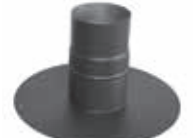
Atravesador de techo circular