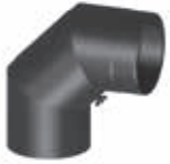
Codo 90° con apertura de limpieza