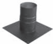
Atravesador de techo cuadrado