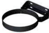
Abrazadera fijación pared regulable 50-80mm