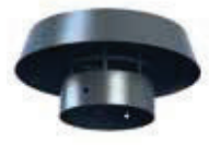
Terminal antilluvia con rejilla