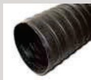
Flexible para conexión de aire 10 m