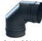
Codo 90° H-H