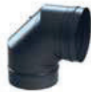
Codo 90° con puerta de inspección