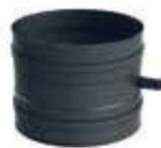
Adapt. de caldera con doble hembra y pto. de insp.