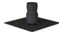
Adaptador a EW-ECO para patinillo