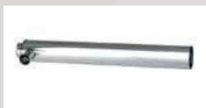
Conexión concent. Estufa +toma de aire Ø60