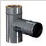
Te aislada picaje concent. y toma de aire Ø80/125