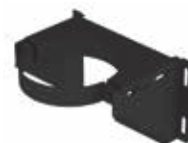
Abrazadera de soporte