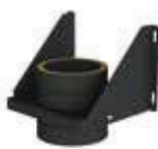
Soporte de carga regulable