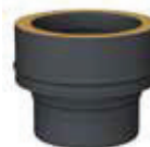
Adaptador simple a doble