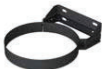
Abrazadera fijación pared regulable 50-80mm