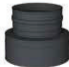
Adaptador doble a simple