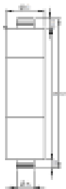
KSD / KSD-B25